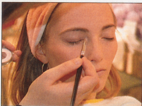
▲ Un eyeliner liquide permet de tracer une ligne d'ombre sur le contour de l'œil.