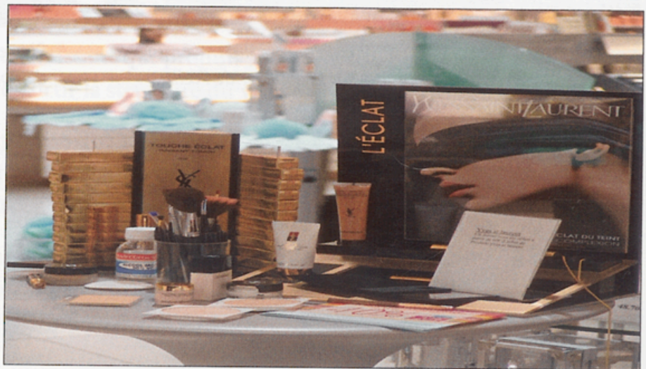
▲ Les produits de maquillage.