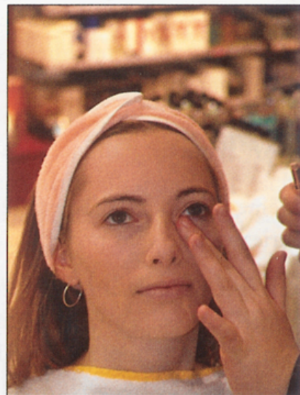
▲ Le crayon anticerne fait des miracles.