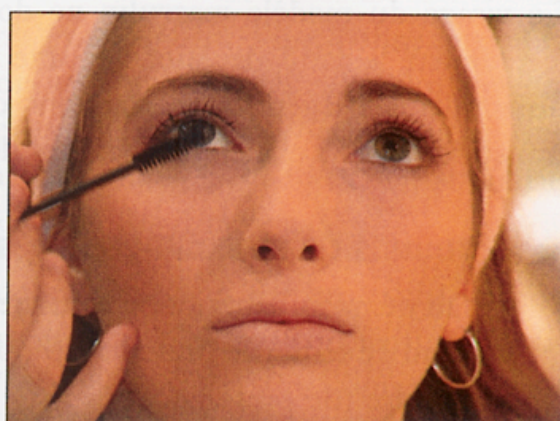
▲ Plusieurs couches de rimmel permettent d'allonger les cils.