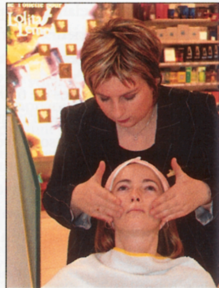
▲ Le nettoyage de la peau afin de préparer celle-ci avant l'application des différents produits.

La poudre permet de matifier la peau et de faire disparaître ses petites imperfections. ►