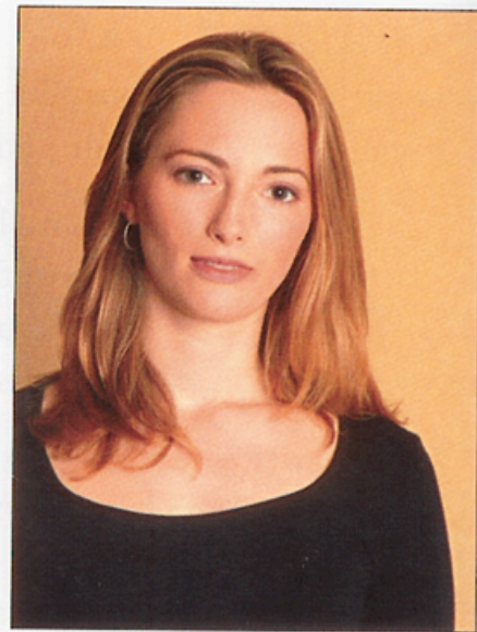
▲ Le modèle en situation dans le studio, la séance de prise de vue peut commencer.