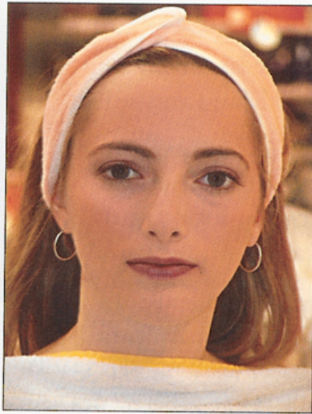
▲ Le fard à joues a été appliqué avec une brosse à poudre dans un ton qui rappelle celui des lèvres.

Appliquez à l'aide d'une brosse à poudre, sur les pommettes, votre fard à joues. Lorsque le visage est rond, le fard s'applique sur les pommettes en diagonale. Pour un visage plus anguleux, étirez le fard vers les tempes et le creux des joues. Enfin, pour un visage plus allongé, le fard se pose sur le dessus des pommettes.